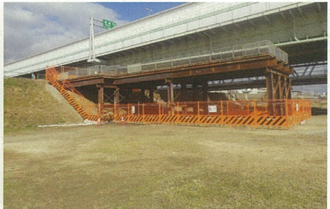
工所用車両転回用ステージ整備